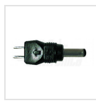
Ø3,5 - 1,35mm