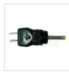
Ø2,35 - 0,75mm