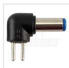
ø5,5 - 2,1mm