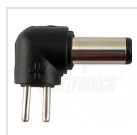
ø5,5 - 2,5mm