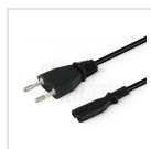
Cavo d'ingresso con spina Europa