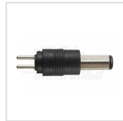
ø5,5 - 2,5mm